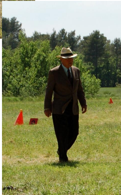
Impressionnante collection de voitures hippomobiles de grande qualité et menées de mains de maître : c'était le 9 e concours international d'attelage de tradition d'Aix en Provence !